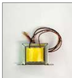
航空機用トランス