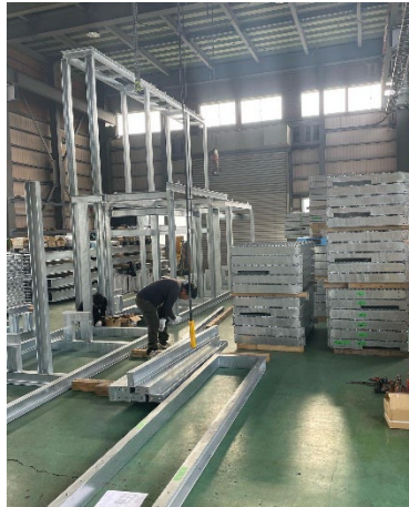
ケーブル配管架台 製 組 施 設