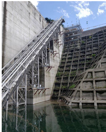
ダム点検船昇降装置 製 組