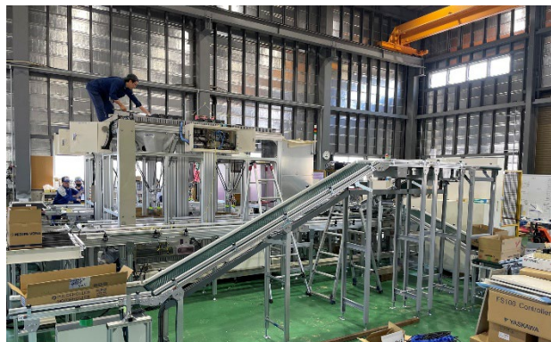
食品加工機 組 搬 設