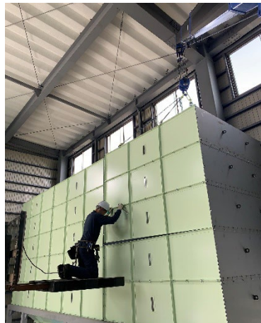
食品備蓄槽 製 組 施 設