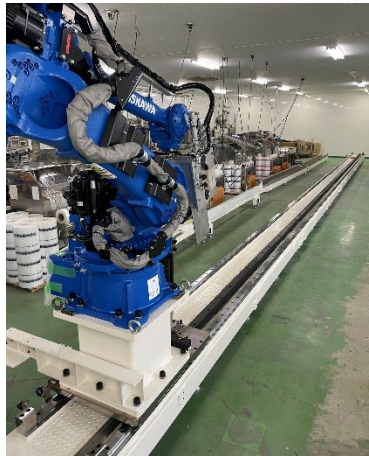
可動式梱包ロボット 組 搬 設