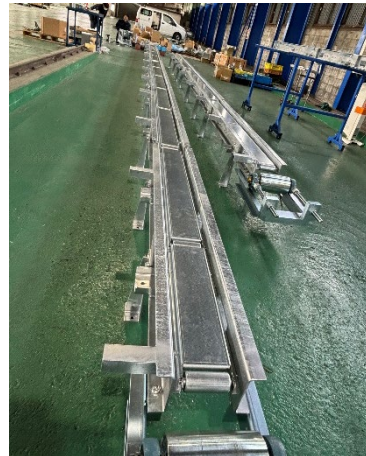
サイクルコンベア 製 組 施 設