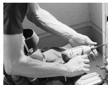
機械器具組立・設置・解体