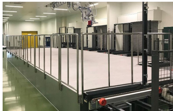
医薬品仕分けステージ 製 組 施 設