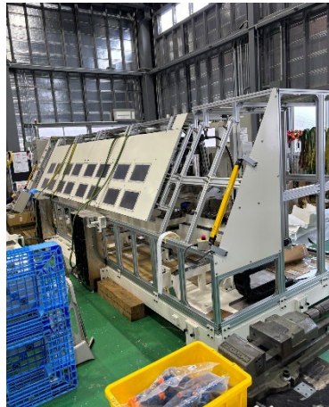
水質検査装置 組 搬 設