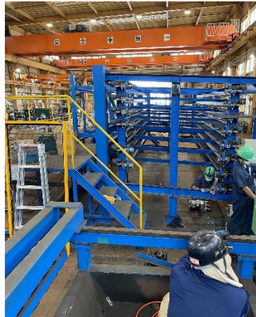
配管スタッカー 組 設