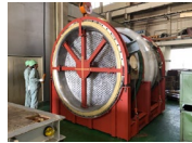
重量14tの熱交換器 二次加工