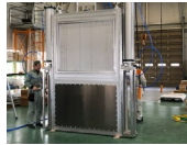
大型真空用 ゲートバルブ